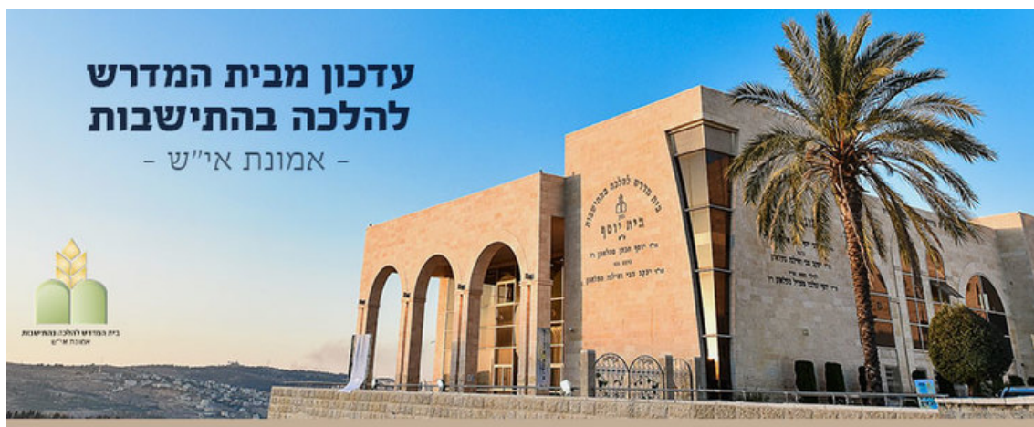
לאתר של בית מדרש <

סוגיות אקטואליות בנושאים שונים הנוגעים למצוות התלויות בארץ